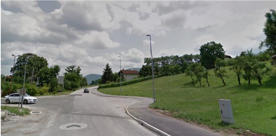
Slika - območje ureditve mini krožišča

Občina Zreče je pristopila k projektu ureditve krožišča na Kovaški cesti v Zrečah (krožišče med Kovaško in Rudniško cesto). Namen ureditve je preureditev trokakega nesemaforiziranega krožišča v mini urbano krožišče, s tem pa umirjanje prometa, izboljšanje prometnega pretoka, večjo prometno varnost in izboljšanje estetskega videza.